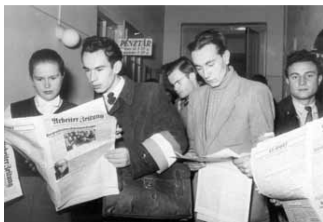
Arbeiter Zeitungot olvasó hallgatók a forradalmi egyetemen 1956. október 30.