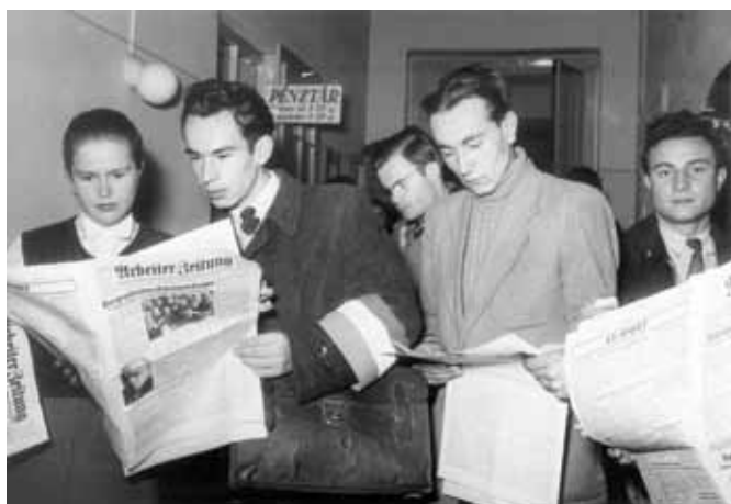
Arbeiter Zeitungot olvasó hallgatók a forradalmi egyetemen 1956. október 30.