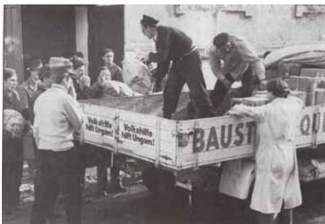
A Volkshilfe segély kipakolása a tornateremnél