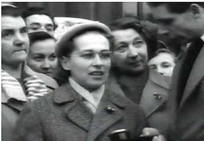
Interjú a BBC hangos híradójának 1956. október 31.