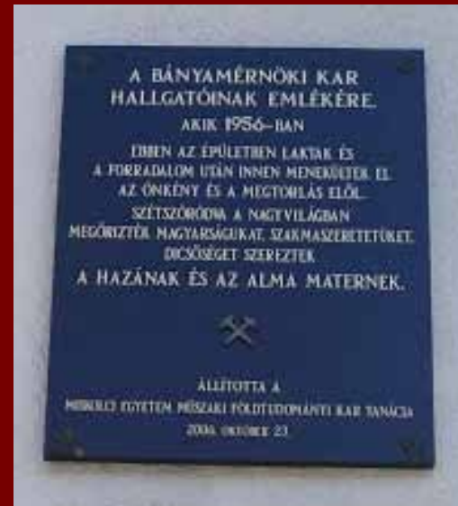
A Közgazdaságtudományi Kar falán