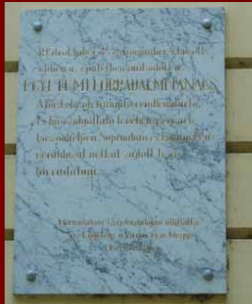
Az A épület falán