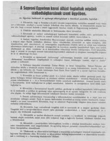
A Soproni Egyetem karainak 16 pontjai (részlet)