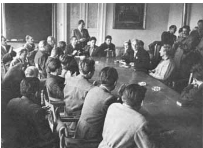
A dékáni tanácssteremben ülésző MEFESZ Bizottság 1956. október 29.