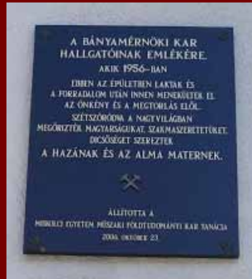
A Közgazdaságtudományi Kar falán