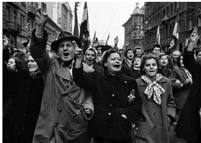
Budapest, 1956. október 23.

A Kossuth téri véres események után vált élessé nálunk is a helyzet. A Forradalmi Bizottság döntése alapján fegyverekhez jutottunk. Kézi fegyvert – tudomásom szerint – először csak a végzős ötdévesek (egy része) kaptak. Ebben logika is volt, mert mi még hallgattunk katonai ismeretek c. tantárgyat katonatiszti előadókban, volt katonai tanszék. 1953 nyarán a Böhönyei Erdőkben állomásozó tüzér egységénél kiképző „kínzó” táborban is részt vettünk. Földben ásott kb. 2.5x2m-es gödörben laktunk négyen, úgy egymás hegyén, hátán. Mi „bunkerlakók” úgy vélekedtünk, hogy az egyetemisták foglalkoztatására összeszedték az országban az alacsony iskolázottságú, vagy anélküli szadistákat. Közben a hatalom úgy tapasztalta, az egyete-