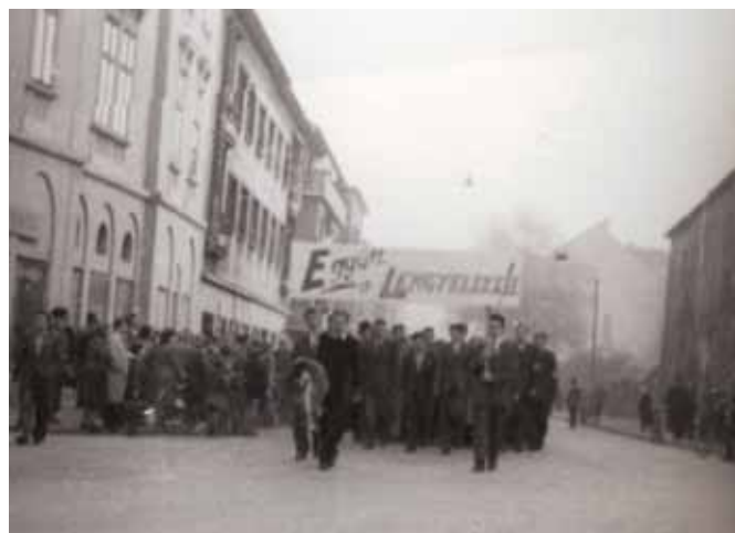
Az egyetemi hallgatók néma tüntetése 1956. október 23.