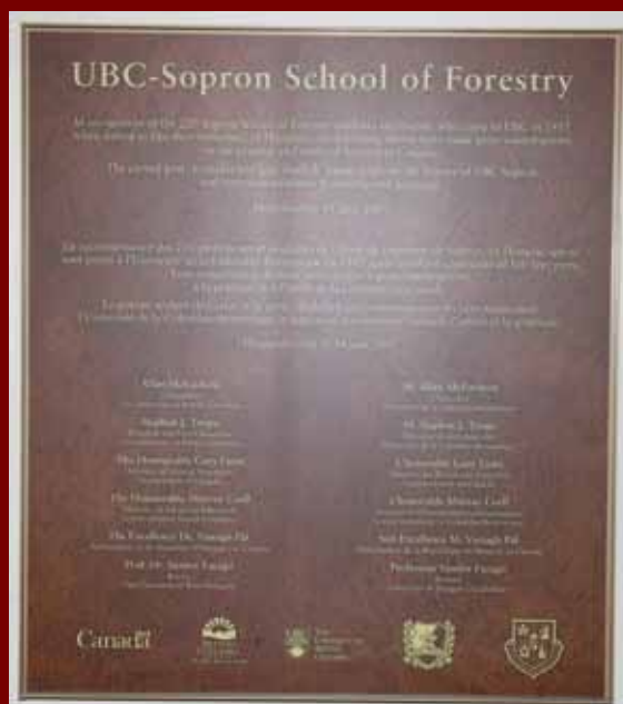
Az Erdőmérnöki Kar tanácstermében