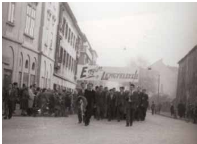
Az egyetemi hallgatók néma tüntetése 1956. október 23.