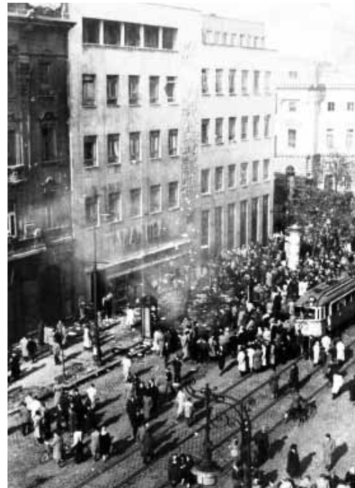
Könyvmáglya a Szabad Nép székháza mellett 1956. október 30.

„...Ezerhétszázhárom, nyolcszáznyvennyolc és ötvenhat: egyszer minden száz évben talpra állunk kínzóink ellen...”