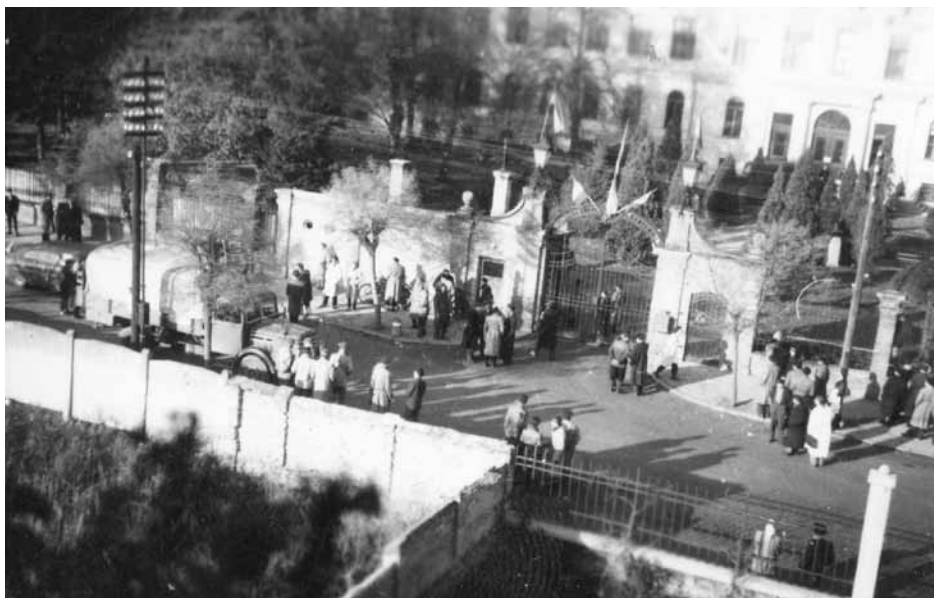
Életkép a forradalmi egyetem előtt. A kép előterében segítségüket felajánló középiskolás diákok láthatóak.

Az 1956. évi forradalom és szabadságharc 60. évfordulóján ez év október 23–25. között ünnepsorozat keretében emlékeznek a Nyugat-magyarországi Egyetem oktatói, dolgozói és hallgatói. Erre az alkalomra egy könyvbemutatóval összekötött gyűjteményes kötet megjelentetését is tervezik, amelyben a szemtanúk visszaemlékezéseit szedik csokorba.