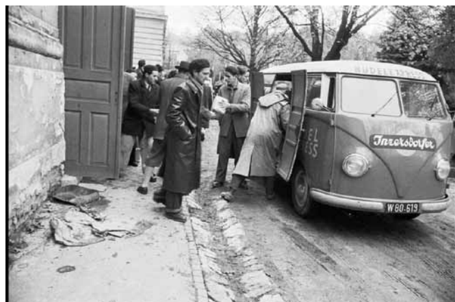
Egy kisteherautó segélyszállítmányát az egyetem tornatermébe pakolják 1956 nov. 1.

– Az Erdőmérnöki Főiskola egyfajta logisztikai központként funkcionált, hiszen az október 28-tól november 4-ig tartó időszakban az osztrák, a svájci és a Nemzetközi Vöröskereszt segélyszállítmányok – gyógyszer folyamatosan érkeztek az intézménybe. A hallgatók és