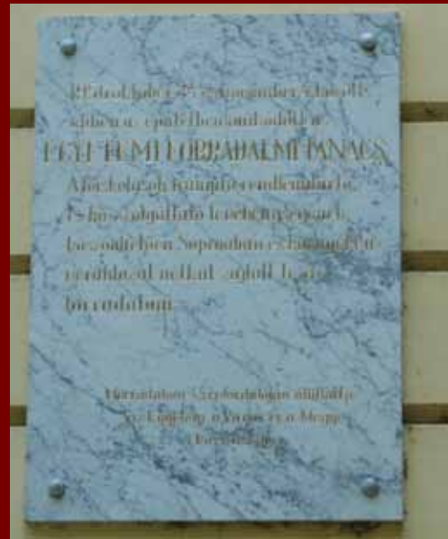
Az A épület falán