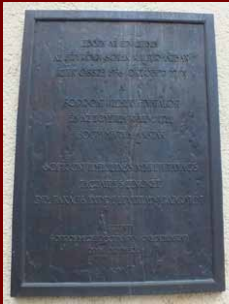
A GYIK Rendezvényház bejáratánál