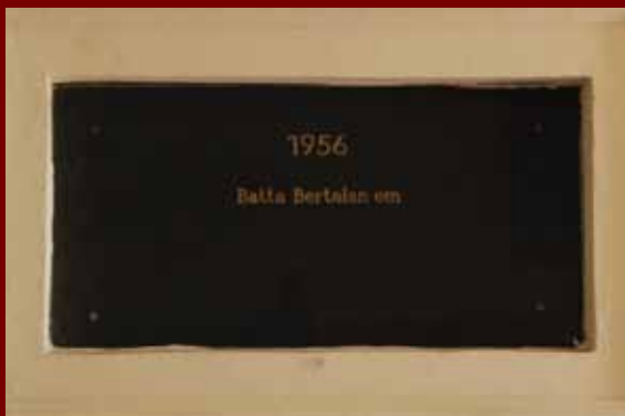
A B épület aulájában