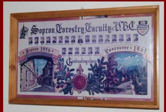
Az Erdőmérnöki Kar tanácstermében