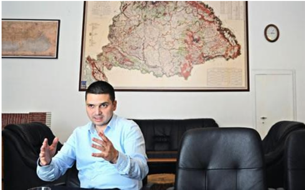
Bitay Márton: Számos közjóléti, szociális feladatot is ellátnak az állami erdők, amelyek nyereségesen működnek

Bitay Márton, a Földművelésügyi Minisztérium állami földekért felelős államtitkára a Magyar Hírlapnak adott interjújában kiemelte: alapos egyeztetésekre lesz szükség arról, hogyan lehet megteremteni az erdőgazdálkodásban az összhangot a természetvédelem, a gazdasági érdekek és a közjóléti funkció között. Az Állami Számvevőszék (ÁSZ) elmarasztaló jelentésével kapcsolatban leszögezte: minden becsületes erdészért és erdőgazdaságért kiállnak.